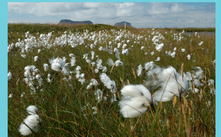
Myrull / Cottongrass