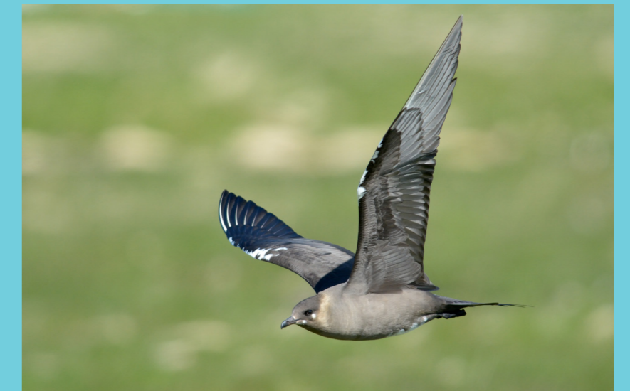
Tyvjo - Arctic Skua