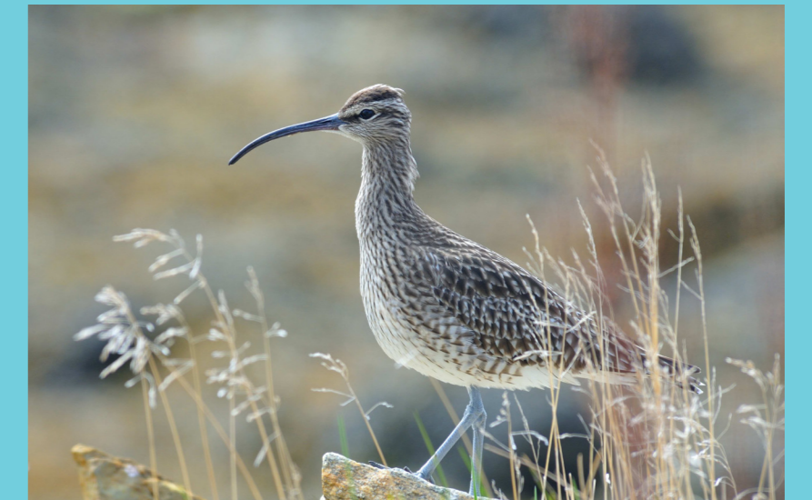
Småspove / Whimbrel