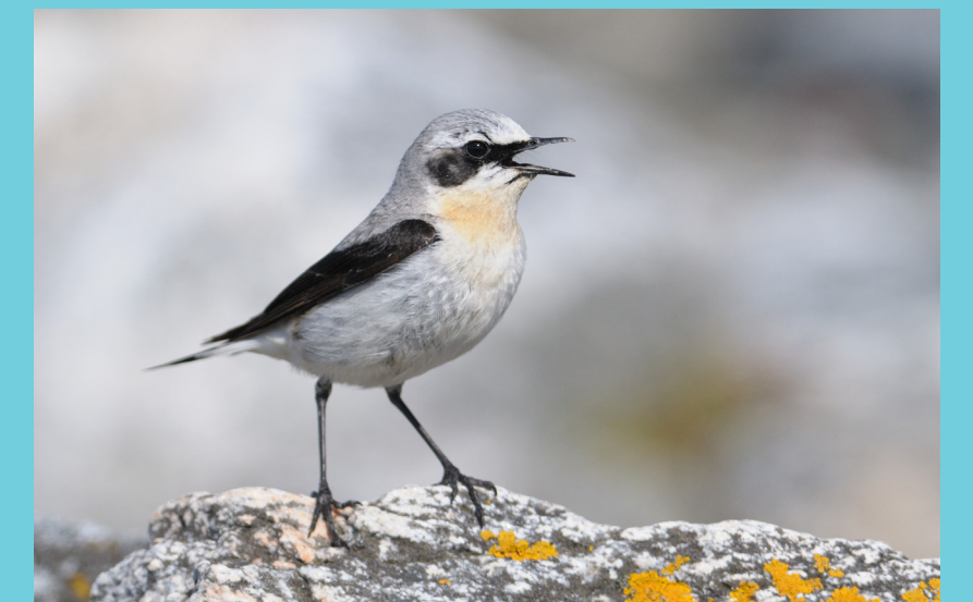
Steinskvett / Northern Wheatear