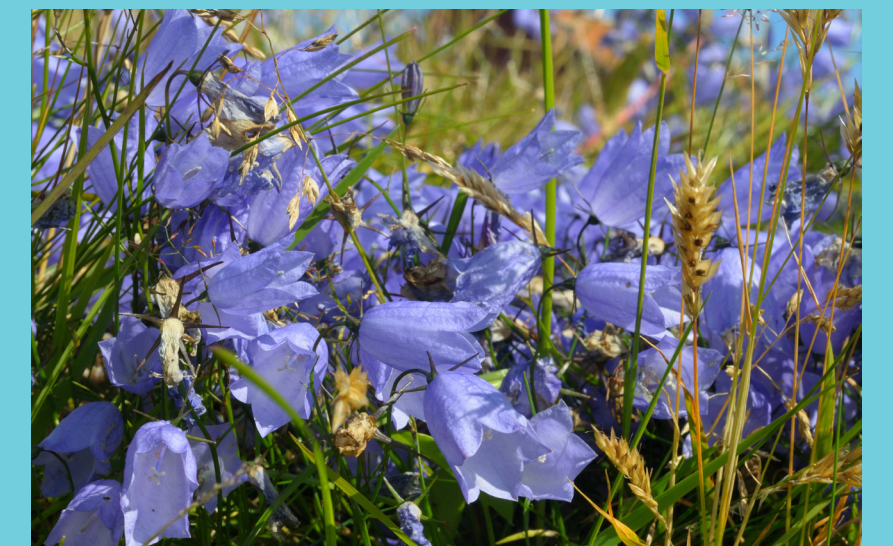
Blåklukke / Harebell